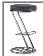
PATTI Nr.: 1.0.13. schwarz blau grau