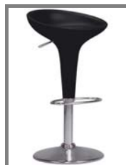
BOMBOS Nr.: 1.0.12. schwarz/chrom weiß/chrom orange/chrom