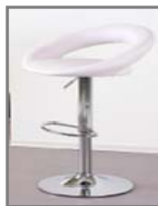
SCOTT Nr.: 1.0.11. weiß/chrom