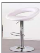
SCOTT Nr.: 1.0.11. weiß/chrom