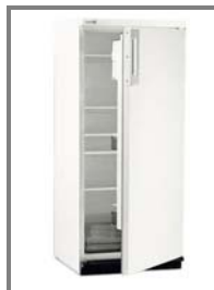
Kühlschrank, 180 l Nr.: 4.0.8.