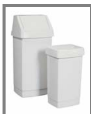
JUMBO Nr.: 4.0.2.