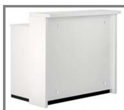
Infocounter CALVI, hinterleuchtet 110/100/70cm