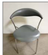
AMELIA Nr.: 1.0..9. grau