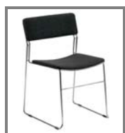
ASTI Nr.: 1.0.6. anthrazit