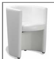
Sessel RONDO Nr.: 1.0.14. schwarz weiß

Kontakt: m+congress gmbh Friesenheimer Straße 6a D-68169 Mannheim