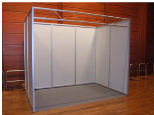
Sichtbares Maß der Wände: H:2400mm, B:950mm