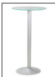
FERMO 110cm ø60 Nr.: 2.0.5.