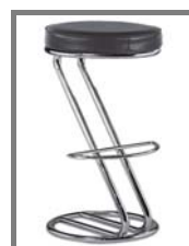
PATTI Nr.: 1.0.13. schwarz blau grau