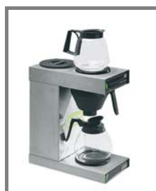
Mocca Profi Nr.: 4.0.9.