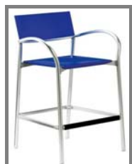
BREEZE BAR Nr.: 1.0.10. alu/blau alu/schwarz