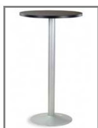
AMATO 106cm ø60 Nr.: 2.0.4.