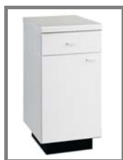
Unterschrank 60 Nr.: 4.0.3.