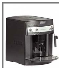
Kaffee-Espresso-Vollautomat Nr.: 4.0.10.

Kontakt: m+congress gmbh Friesenheimer Straße 6a D-68169 Mannheim