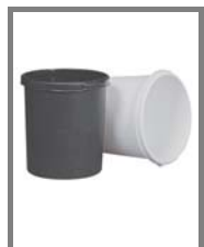
Papierkorb Nr.: 4.0.1.