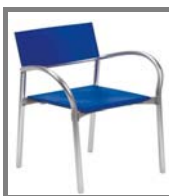
BREEZE Nr.: 1.0.8. alu/blau alu/grau alu/schwarz