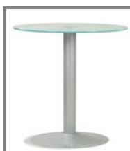
FERMO ø70 Nr.: 2.0.2.