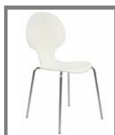
BUNNY Nr.: 1.0.7. weiß rot blau