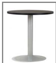
AMATO 70cm, ø70 Nr.: 2.0.1.