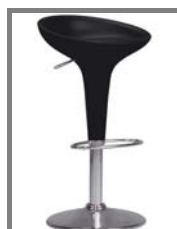
BOMBOS Nr.: 1.0.12. schwarz/chrom weiß/chrom orange/chrom