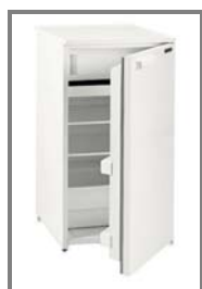
Kühlschrank, 128 l Nr.: 4.0.7.