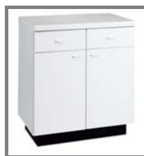
Unterschrank 90 Nr.: 4.0.4.