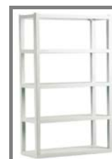
Regal Nr.: 4.0.6.