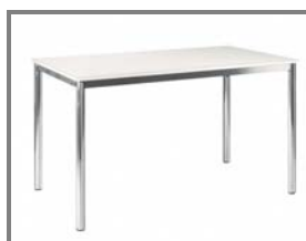
MERIDA 120/70/75cm Nr.: 2.0.3.